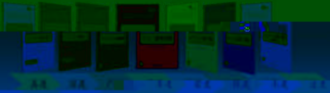
一体化课程教学设计 综合实训基地